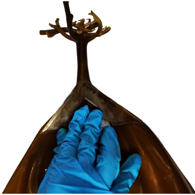
图B.1 用三角板测量海带的叶基部夹角